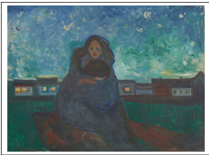
Edvard Munch, Unter den Sternen, 1900–05, Öl auf Leinwand, 90 × 120 cm, Munchmuseet, Oslo

Auch im Jahr 2019 bietet der Canthe Kunstverein wieder eine Exkursion an.